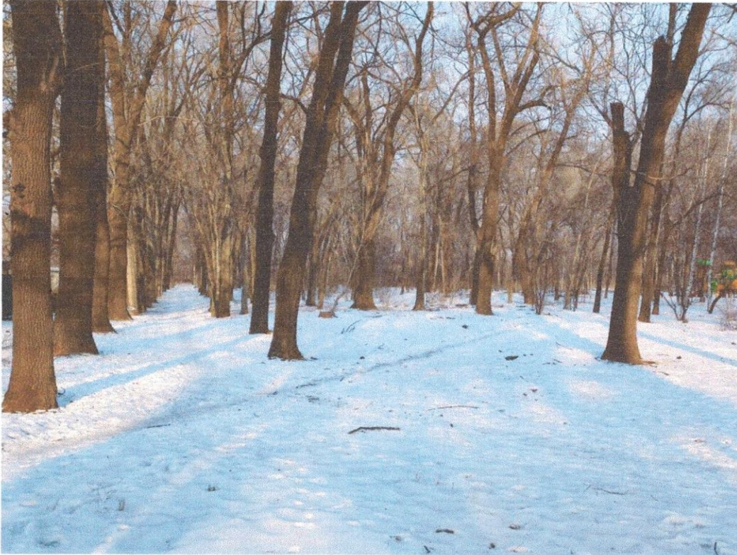
Фото территории, предлагаемой для обустройства:

Настоящим проектом предлагается обустроить в парке пешеходные дорожки, которые можно использовать как «Тропу здоровья».